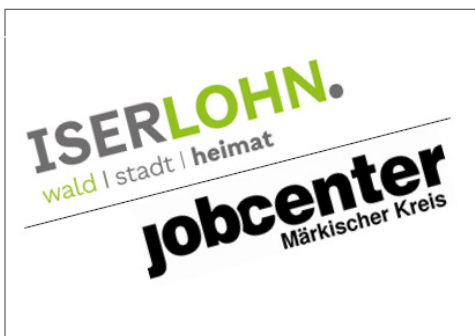
wechselnde Mitarbeiter der Stadt Iserlohn und des Jobcenters Märkischer Kreis (DO, 16 - 18 Uhr)