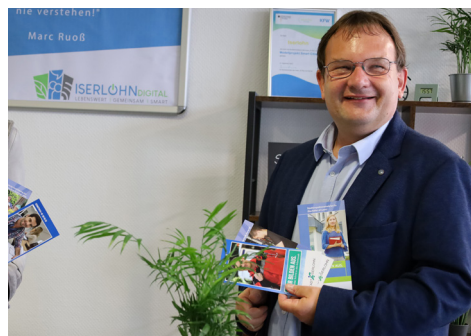
Servicestelle Ehrenamt Hinrich Riemann (MO, MI, FR wechselnd) Termine stehen auf der Website